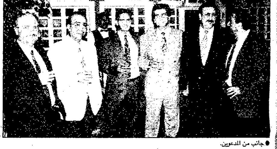
جانب من المدعوين